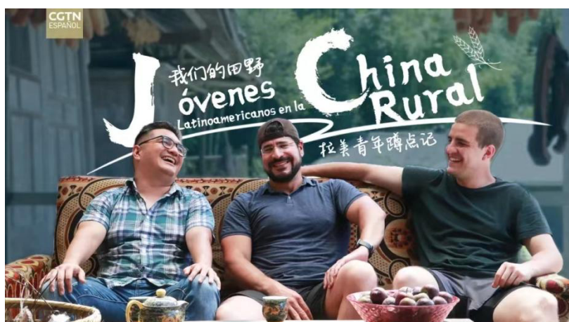
Gráfico 3. “Narradores en charlas”, Tres jóvenes narradores latinoamericanos mantienen un agradable intercambio en un patio de la aldea de Tianba. Cartel del documental Jóvenes Latinoamericanos en la China Rural