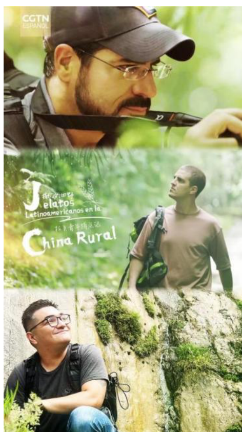
Figura 1. "Narradores en el campo"-Cartel del documental Jóvenes Latinoamericanos en la China Rural

Ante una situación mundial confusa, hay muchos problemas urgentes a los que hay que dar respuesta, por ejemplo, cómo resolver los problemas de desarrollo a los que se enfrentan China y América Latina, y cómo promover conjuntamente la comunidad de destino China-América Latina hacia una nueva etapa. Desde la perspectiva de la comunicación regional, y a través de la planificación, creación y difusión del documental Jóvenes Latinoamericanos en la China Rural (我们的田野:拉美青年蹲点记), este papel pretende responder a la pregunta de cómo podemos hacer un buen uso de la práctica del desarrollo de China para entablar diálogos interregionales, y hacer uso de las plataformas mediáticas para difundir el conocimiento público y lograr un aprendizaje mutuo para el desarrollo.