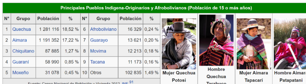
Figura 1. Grupos aborígenes de Bolivia

En marzo de 2009, Bolivia cambió su nombre por el de Estado Plurinacional de Bolivia, estableciendo el carácter multiétnico de este país latinoamericano con reconocer la diversidad etnocultural. La plurinacionalidad se refiere principalmente a los pueblos indígenas. Según los datos, existen en total 36 grupos aborígenes en el país, siendo los quechuas los más numerosos, seguidos por los aimaras y los guaraníes.